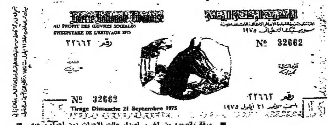
ورقة يانصيب من اصدار حالات الأحداث دون اجراء سحب

١٦٠ ويبلغ عدد اوراق الحفظ المأمور ١٦٠ الف ورقة ، ثلث الواحدة منها ٥ اريات ، وقد بيع بعضها وبيع البعض الاخر واخرى منها ٥٥٠ ورقة فقط . ويرى المدير اليانصيب ان افضل حل